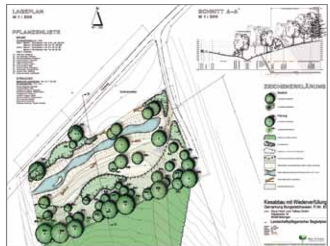
Funcționalitatea planurilor va permite sa creati planuri cu stiluri distincte (plan situatie Burgadelzhausen, Mayr & Robbe Landschaftsarchitekten, Gablingen, D)